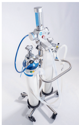
T205515 & T205520