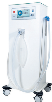
T205514 & T205518