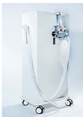
T205515 & T205518